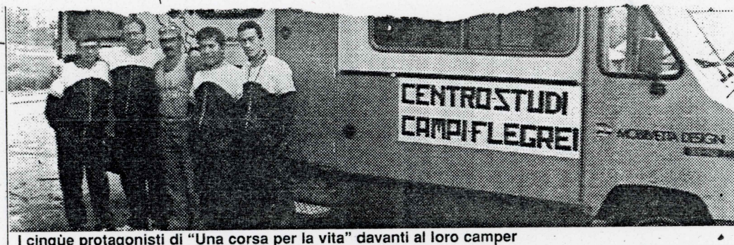
I cinque protagonisti di "Una corsa per la vita" davanti al loro camper

Missini riuniti per un dibattito sul tema del terrorismo