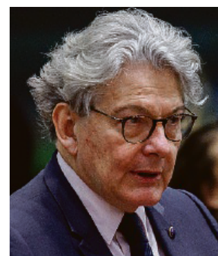
RESPINTO Thierry Breton, 70

Uno studio di Bankitalia dà un dispiacere ai catastrofisti per i dazi di Trump. Prima dello choc, gli esportatori italiani verso gli Usa avevano un margine medio di profitto del 10,1%. Ora, con i dazi, si stima una riduzione dei margini di circa 0,3 punti percentuali per la maggior parte delle imprese (circa il 75%). a pagina 17