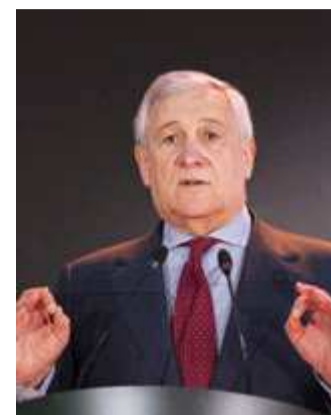
Antonio Tajani

SUL FRONTE POLITICO protesta con vigore la sola Avs. «È un provvedimento di servilismo verso il governo di Israele», commenta il capogruppo al Senato Peppe De Cristoforo, «in cui i nostri governanti dimostrano di non conoscere affatto Yahya al Sarraj che pochi giorni fa insieme ad altre 15 personalità della società civile