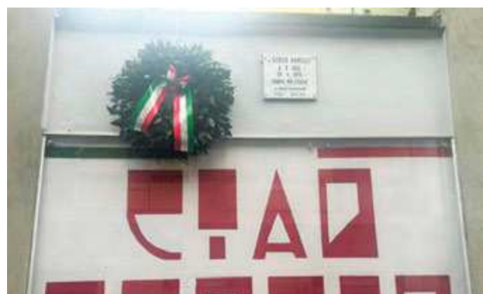
Lapide in memoria di Sergio Ramelli a Milano

■ È la prima volta che una scuola viene intitolata a Sergio Ramelli, giovanissimo ucciso nel 1975 a Milano a causa delle sue simpatie neofasciste. La scelta dell'amministrazione comunale guidata da Pippi Mellone, da sempre vicino all'estrema destra e oggi sindaco in quota Lega, accende lo scontro in città. La delibera approvata subito prima di Natale dalla giunta deve comunque passare il vaglio del prefetto di Lecce, ma se secondo alcuni deve avere l'ok anche del consiglio d'istituto e de collegio dei docenti.